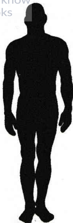
Figura 1.3. Dublul eteric

Oamenii care își dezvoltă pentru prima dată vederea aurică văd dublul eteric ca pe un spațiu între corpul fizic și aura propriu-zisă. Totuși, pe măsură ce vederea li se dezvoltă, devin conștienți că dublul eteric are o nuanță cenușie, dar strălucește constant, se mișcă și își schimbă culoarea. Această mișcare constantă în interiorul dublului eteric creează o mare varietate de culori aproape luminoase, delicate și în continuă schimbare. Dublul eteric este numit uneori „aura sănătății”, întrucât bolile sunt observate aici ca o pată întunecată sau o întrerupere în mișcările auri. În cele din urmă, zona seamănă cu un bazin întunecat, stagnant, în interiorul dublului eteric. Starea precară de sănătate poate fi determinată și prin pierderea colorației în dublul eteric; probabil de aceea este atât